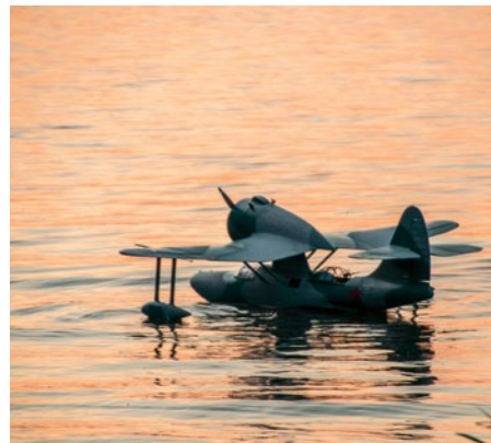
Jedem sein Wasserflugzeug