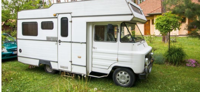
Impressionen vom Standplatz

Es ist einfach viel zu schön hier, sodass wir anderntags nochmals 15 Euro bezahlen und nochmals eine Nacht auf diesem Campingplatz bleiben. Irgendwie schade und doch einfach nur schön. Wir wollten uns ja ein paar Eindrücke von Tschechien reinziehen und jetzt hängen wir immer noch keine