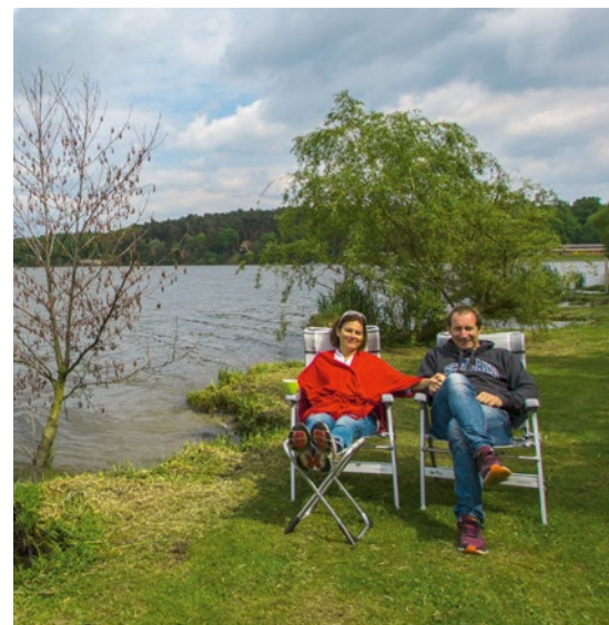
... lädt zum Chillen ein.