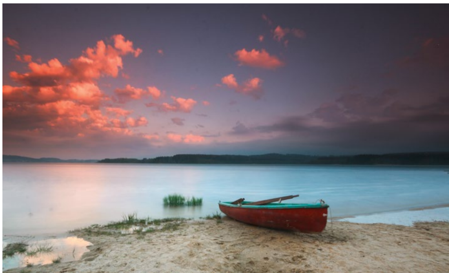
Die herrliche Stimmung am See ...

Anderntags mussten wir dann ausschlafen und die Ruhe geniessen. Das Fest ges-