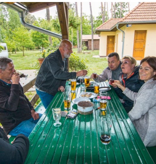
Feuchtfrihliches Palavern in Tschechisch, Deutsch und Englisch mit anschliessender Einladung zur Geburtstagsfeier