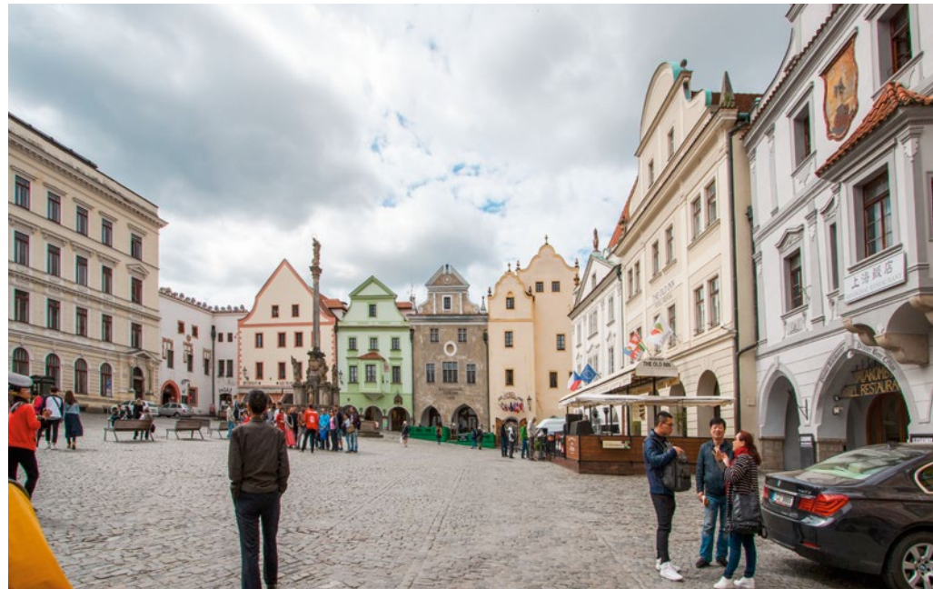
Altstadt von Krumau