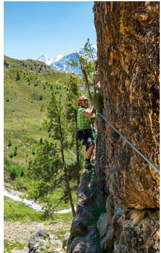
Schwindelfreiheit ist gefragt