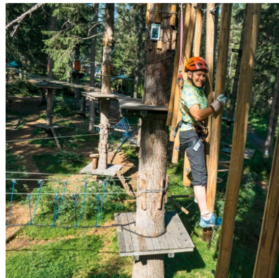
Seilpark Sur En