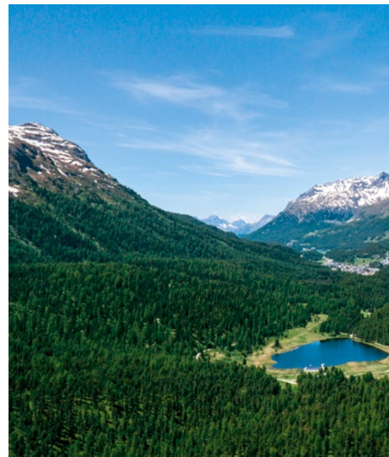
Gleitflug über dem Stazersee